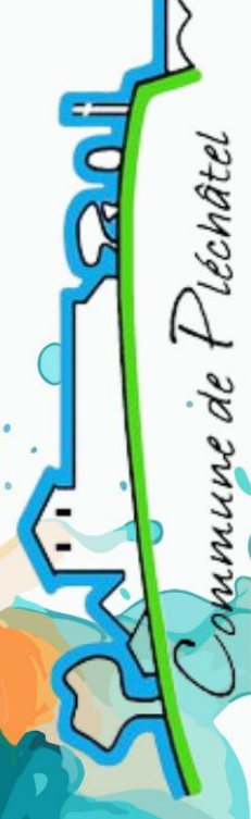
Commune de Pléchâtel